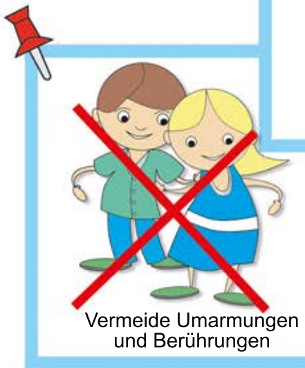
Vermeide Umarmungen und Berührungen