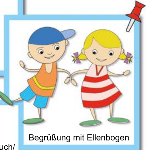
Begrüßung mit Ellenbogen