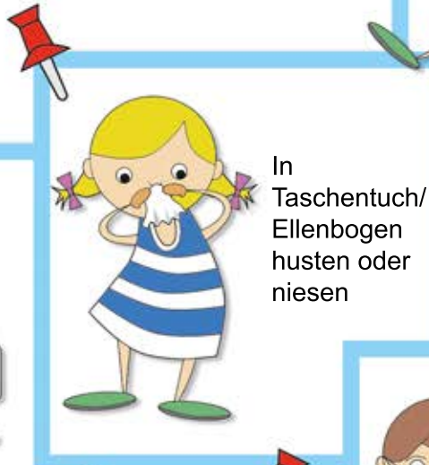
In Taschentuch/ Ellenbogen husten oder niesen