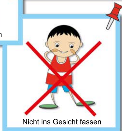
Nicht ins Gesicht fassen