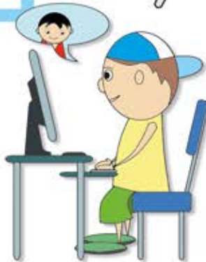
Chatten statt besuchen