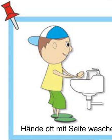
Hände oft mit Seife waschen